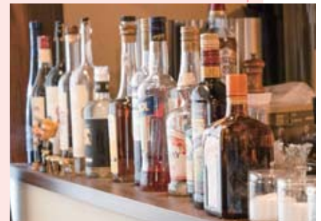
ความหลากหลายของไวน์ก็เป็น อีกเหตุผลหนึ่งที่ได้รับคามนิยม