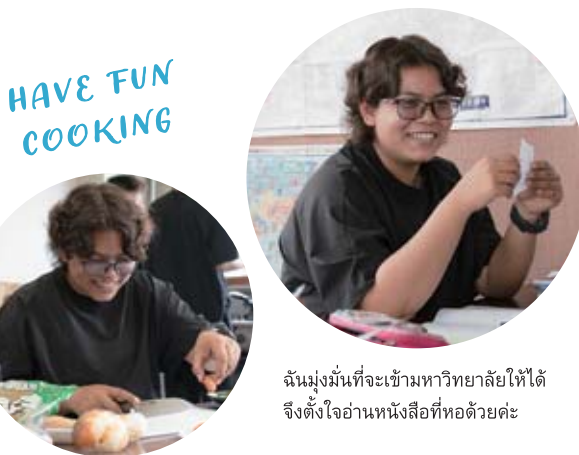
ฉันมุ่งมั่นที่จะเข้ามหาวิทยาลัยให้ได้ จึงตั้งใจอ่านหนังสือที่หอด้วยคะ