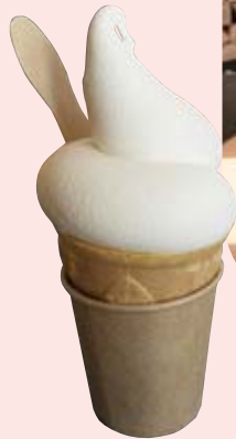
ไอศกรีมซอฟต์เสิร์ฟที่ทำจากวัตถุดิบ ในนากาชิเบ็ตสึก็เป็นที่นิยมเช่นกัน

ชั้น 1 เป็นร้านขายดอกไม้ ชั้น 2 เป็นร้านขายอุปกรณ์สำหรับกิจกรรมกลางแจ้งและกาแฟ ภายในร้านถูกจัดให้มีบรรยากาศเสมือนกลางแจ้งซึ่งได้รับความนิยมมาก และสามารถซื้อกาแฟแซนด์วิช ฯลฯ กลับบ้านได้อีกด้วย