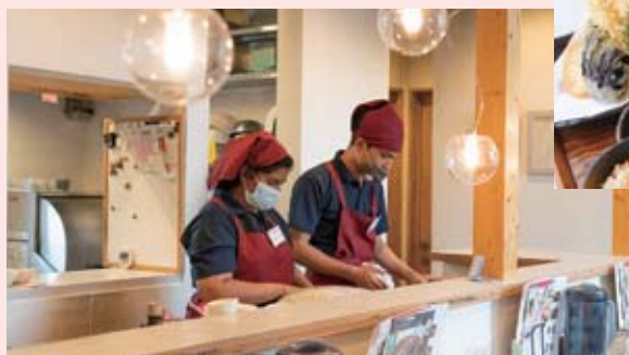
นักศึกษต่างชาติก็ทำงานที่นี่ด้วย

ร้านชาบูกิ อูด้งแห่งเดียวในฮอกไกโดตะวันออก เป็น "อูด้ง" ที่กินแล้วสดชื่น กินง่าย จึงเป็นร้านอาหารญี่ปุ่นที่ได้รับความนิยมในหมู่นักศึกษาต่างชาติเช่นกัน