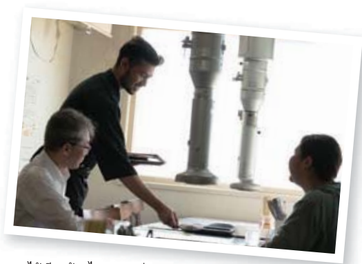
ผมได้เรียนรู้อะไรหลายอย่างจากการทำงานพาร์ทไทม์ด้วยเหมือนกันครับ

A ที่นากาชิเบ็ตสึ ทั้งครูและผู้คนในเมืองต่างก็ใจดี ผมรู้สึกว่าเป็นที่ที่ค่อนข้างสบายครับ การเรียนที่โรงเรียน นอกจากจะเรียนภาษาญี่ปุ่นแล้ว ยังได้เรียนรู้สิ่งต่างๆ มากมาย เช่น การไปทัศนศึกษาออกสถานที่ที่ให้นักเรียนได้สัมผัสวัฒนธรรมหรือชมทิวทัศน์อันสวยงามของประเทศญี่ปุ่นร่วมกัน สนุกมากเลยครับ ตอนอยู่ที่ประเทศบ้านเกิด ผมชอบออกกำลังกายมากๆ ครับ ผมมักจะเล่นฟุตบอล วอลเลย์บอล และคริกเก็ต ฯลฯ พอมาอยู่ที่นี่ ผมก็จะรีเฟรชตัวเองด้วยการไปเล่นกีฬาที่โรงยิมหรือพุดคุยกับเพื่อน ในเวลาพักครับ