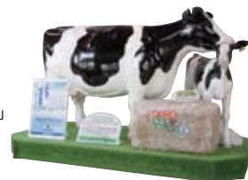
รูปปั้นวัวคอยต้อนรับอยู่ที่สนามบิน

“สนามบินนากาชิเบ็ตสึ” อยู่ทางตะวันออกเฉียงใต้ของญี่ปุ่น มีพื้นที่กว้างใหญ่และทิวทัศน์อันงดงาม ภายในรัศมีประมาณ 100 กม. จากสนามบิน เป็นที่ตั้งของมรดกโลกทางธรรมชาติ เช่น อุทยานแห่งชาติชิโรโทโกะ อุทยานแห่งชาติอดัมมัตสึ และอุทยานแห่งชาติคูชิโระ ซิตสึเก็น เป็นต้น ทำให้ที่นี่เป็นประตูสำคัญสู่การท่องเที่ยวในฮอกไกโดตะวันออก