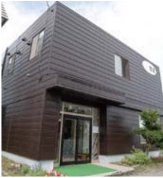
落ち着いた雰囲気の外観です。

多国籍の留学生が暮らす寮は、みんなで過ごす空間も、一人でゆっくり過ごしたいプライベートの時間も過ごしやすい作りとなっています。