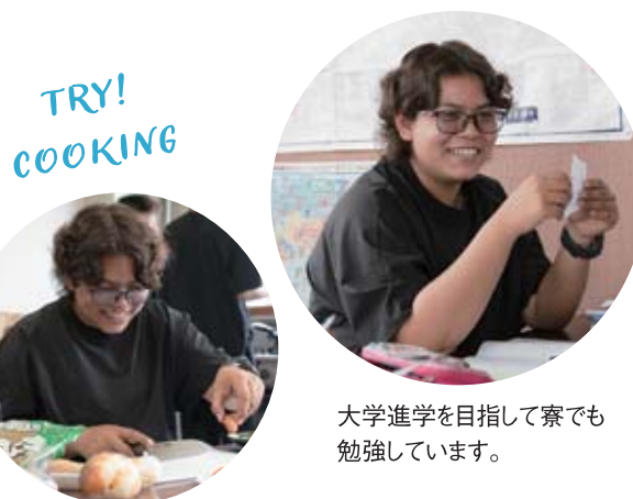
大学進学を目指して寮でも勉強しています。