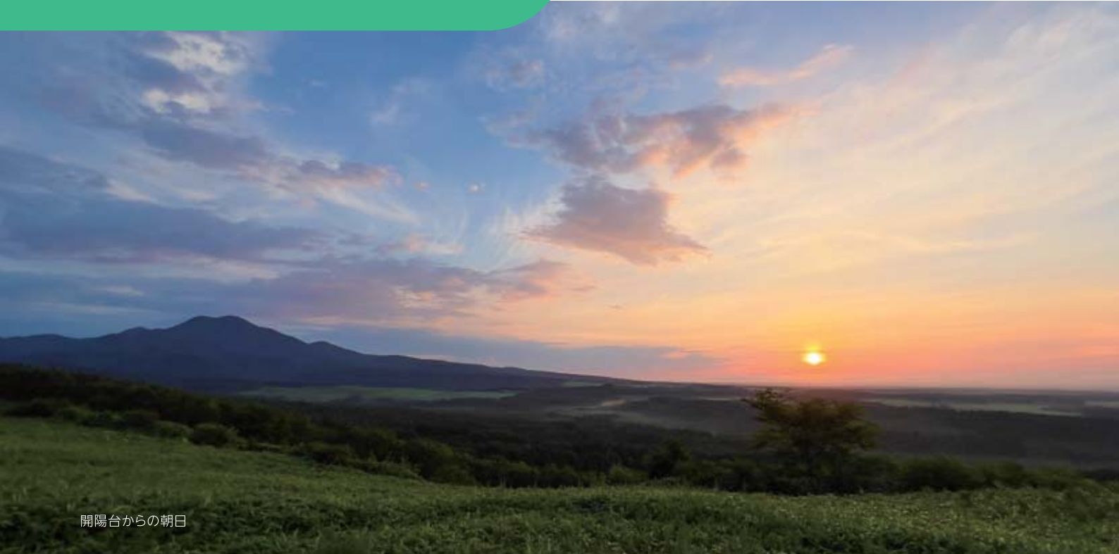
開陽台からの朝日

中標津町は雄大な大地に囲まれ、その美しい景色は日々の疲れを癒してくれます。近隣にも観光スポットがたくさんあり、充実した日々を送れます。